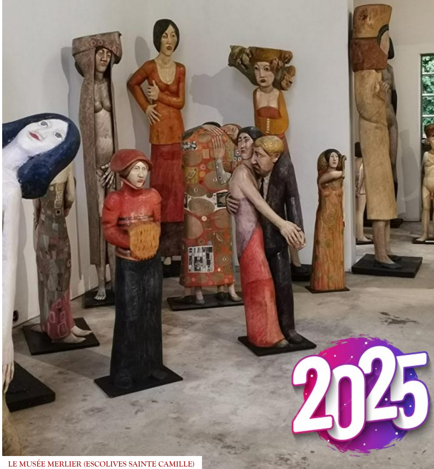
LE MUSÉE MERLIER (ESCOLIVES SAINTE CAMILLE)