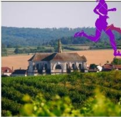
Coulanges la Vigneuse