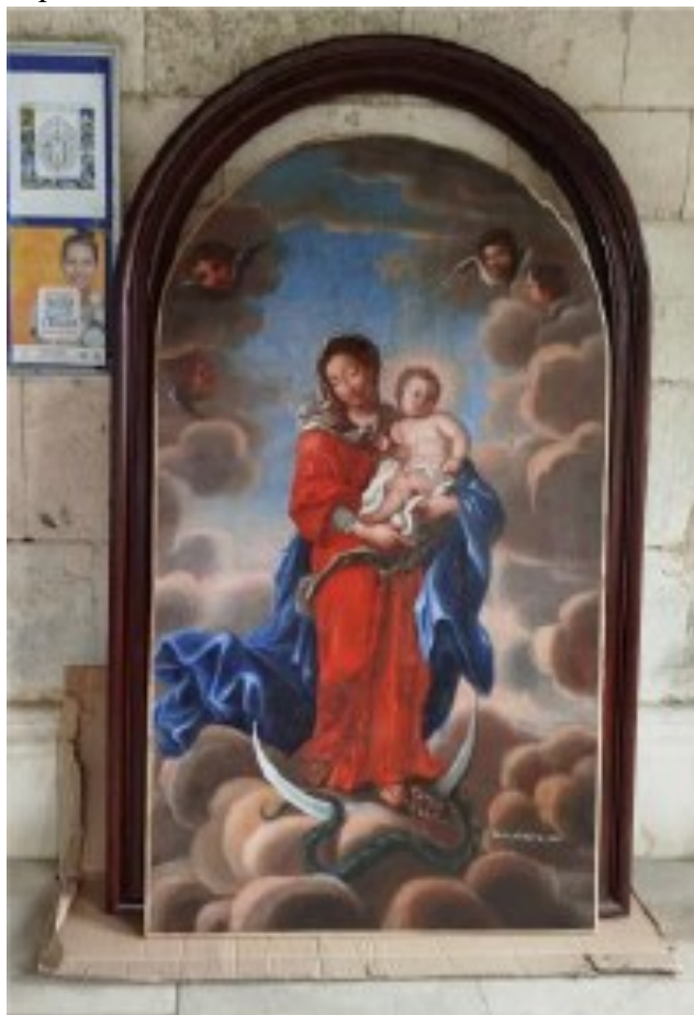
Après la restauration

En 2025/26 nous envisageons de financer l'ouverture des vitraux pour préserver les tableaux des moisissures. Nous devons également redonner le tableau du baptême du Christ qui a souffert du manque d'aération de l'église.